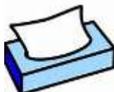
ティッシュ ペーパー